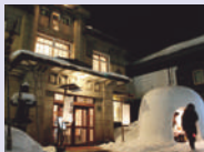
ゲストハウス平源

☀️ こうじ庵 期間限定“古民家カフェ”がオープン! (10:00～21:00)